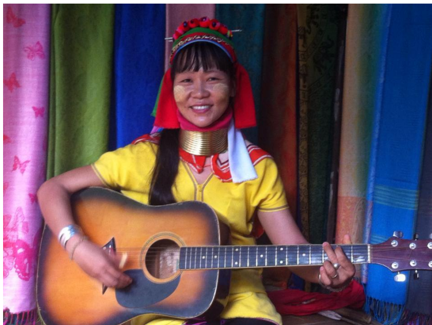
Udito. Foresta di Mae Rim, Chiang Mai.