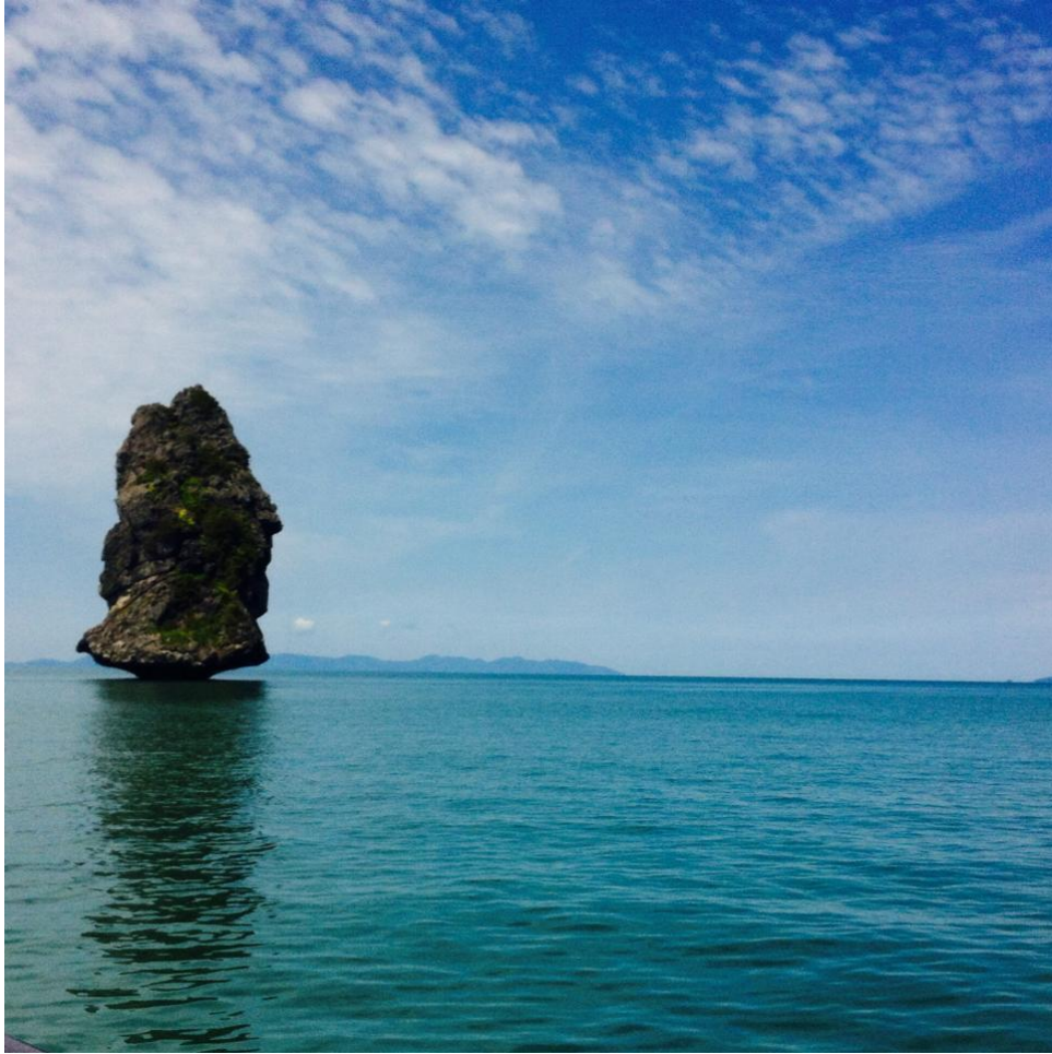
Vista. Profilo di uomo che osserva l'orizzonte, Koh Samui.