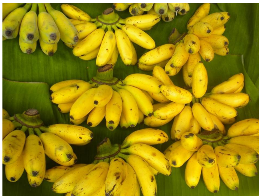
Gusto. Mercato galleggiante di Damnernsaduak.