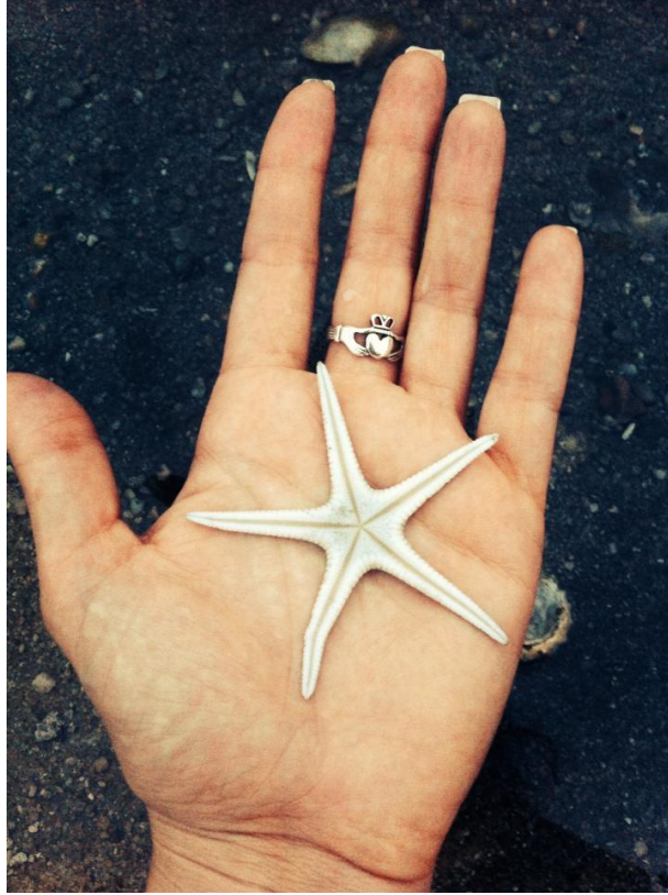
Tatto. Isola di Koh Samui.